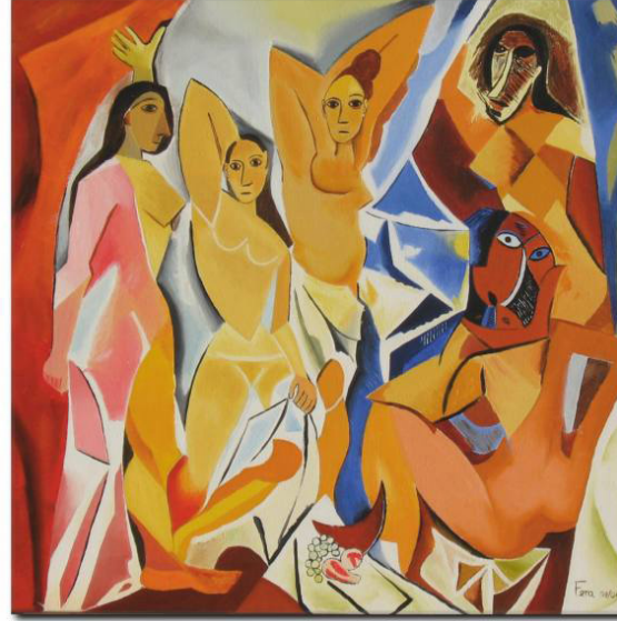
* Avignonlu Kızlar - Picasso

Kilise tarafından, reform hareketiyle birlikte daha baskıcı bir ahlak anlayışı ortaya çıkarılmış, Aziz Augustine ve Aziz Thomas'ın görüşlerini kilise de benimseyerek evlilik kurumunun iyileştirilmesi gerektiği düşünülmüş, özellikle genç erkeklerin seks işçiliğinden